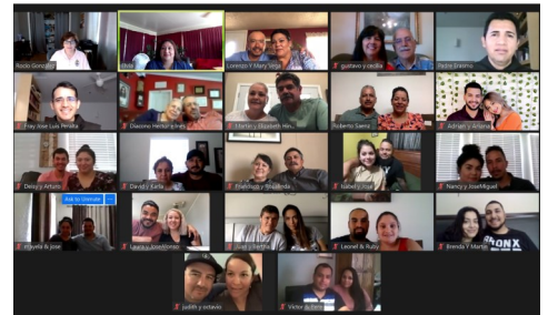
Participantes del retiro "Nos Vamos a Casar" Julio 2021

Ya que el cupo es limitado, pedimos a las parejas interesadas en participar en un retiro de preparación matrimonial próximamente, a que se comuniquen directamente con la Oficina del Ministerio Hispano para recibir la información necesaria llamando al 505-831-8147 o en ebecerra@archdiosf.org .